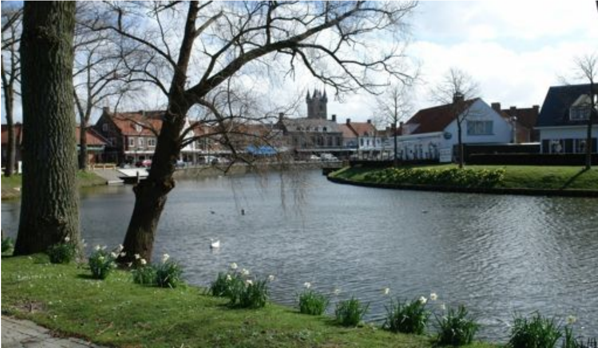
Sluis, gebouwd in de tweede helft van de 13 de eeuw. Versterkte stad onder Lodewijk van Maele, graaf van Vlaanderen. De meest Vlaamse stad in de Nederland.