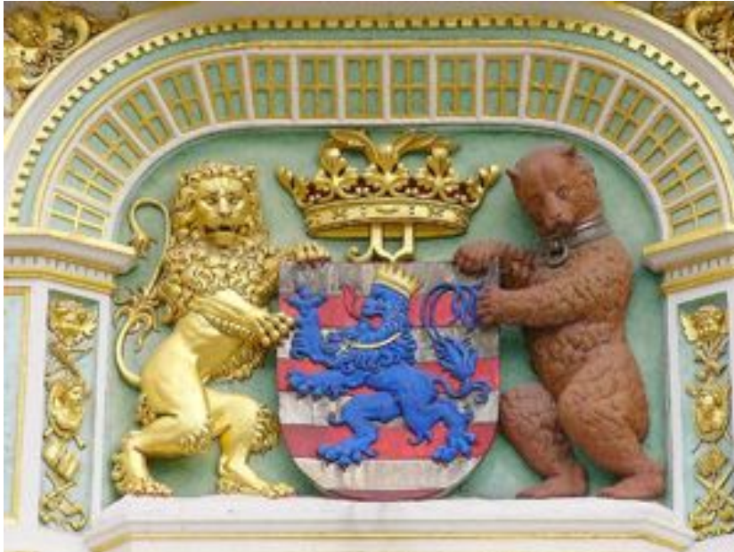
Stadswapen van Brugge

In 1297 kreeg de stad nieuwe stadswallen en 9 stadspoorten, tijdens de regering van Filips de Schone. Ontstaan van de Beurs: eerste betalingen per wisselbrief.