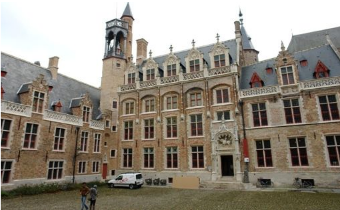
Het Paleis van Gruuthuyse

Gelegen in de Gruuthuysestraat, in het verlengde van de Dyver, werd het paleis in 1955 omgevormd tot het Stedelijk Gruuthuysemuseum.