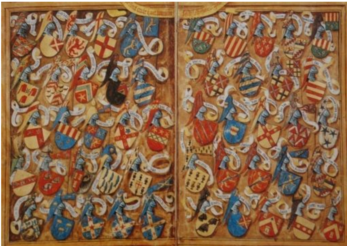
Tableau met de wapenschilden van de deelnemers aan het toernooi van 11.03.1391