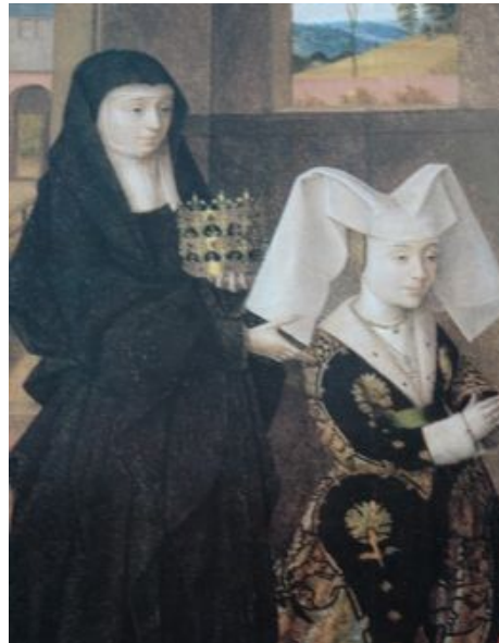
Infante D. Isabel van Portugal

2. Karel de Stoute (1433-01.1477), vanaf 27.04.1465 meester van Bourgondië. Hij legde een zware fiscale druk op het land om zijn oorlogen te kunnen betalen.