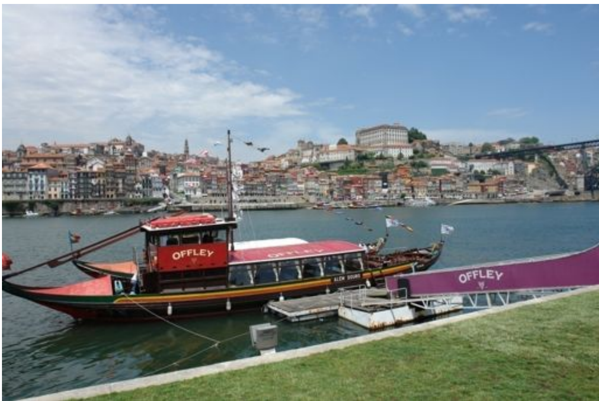
Porto, bairro Ribeira

Meerdere afstammelingen van Luso-Vlaamse gezinnen uit de Azoren hebben mij vanuit Amerikaanse landen e-mails gestuurd om mij mede te delen dat deze studie hen geholpen heeft bij het samenstellen van hun stamboom. Dat doet me uiteraard plezier, want zo weet ik dat de 10 jaren na mij 70 ste geen verloren jaren geweest zijn. De Nederlandse tekst met gegevens uit enkele Vlaamse bronnen van vóór de emigratie en Portugese bronnen uit de tweede helft van de 15 de , zullen even de sluier opgelicht hebben, die sinds 1435 gevallen was over “onze vergeten zonen en dochters” en hun duizenden afstammelingen, in de afgelopen circa 590 jaar verspreid over alle continenten.