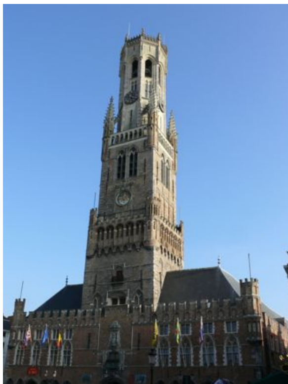
Het Belfort op de Grote Markt van Brugge Gebouwd in 1240, 83 m hoog, 366 trappen, 47 klokken.

Tussen 1200 en 1300 werden er 6 kloosters gesticht. In 1204, eerste steenlegging voor de bouw van de Hallentoren, op koeienhuiden op de drassige bodem van de markt. De hallen daarnaast werden eerst gebouwd in 1364.