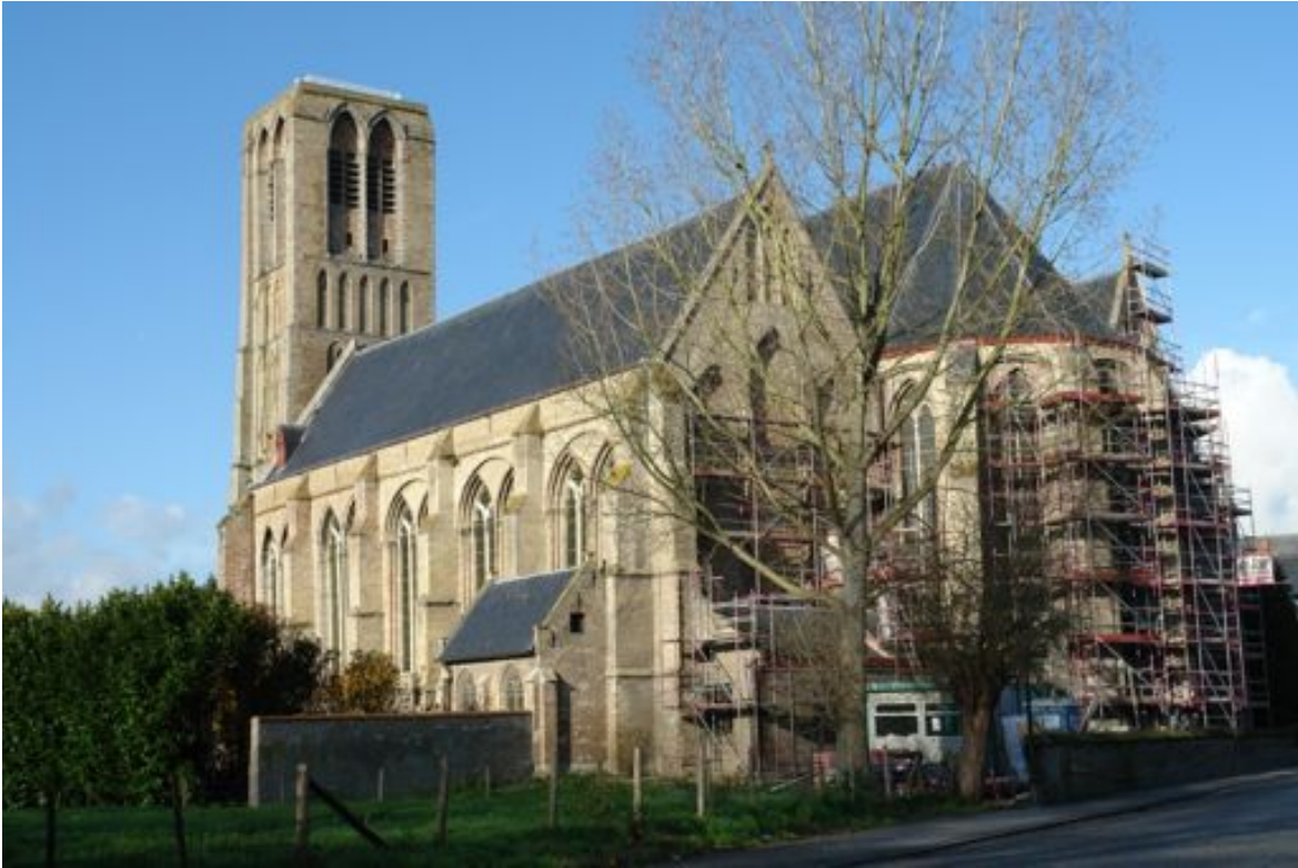
De Hallenkerk van Damme (14 de eeuw) is de omvormde O.L. Vrouw Hemelvaartskerk uit de 13 de eeuw