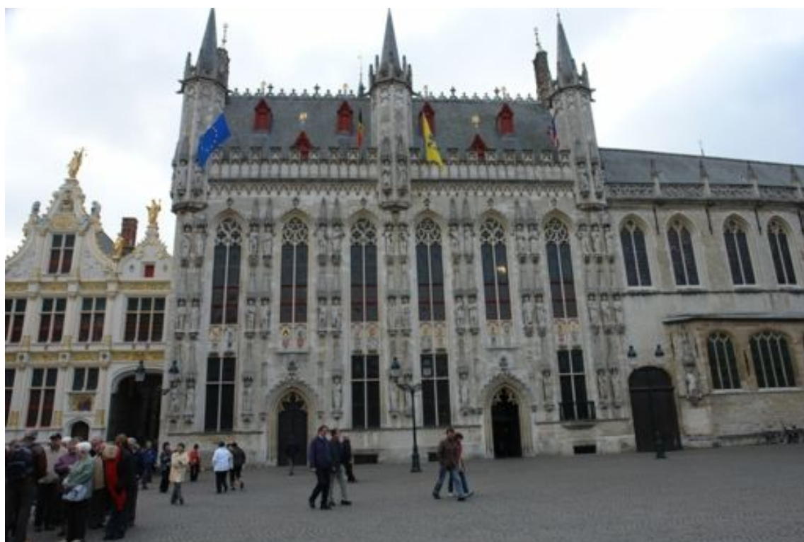
Justitiepaleis, en stadhuis (1376) met gotische zaal en 19 de eeuwse muurschilderijen op de Burg te Brugge

Ca 1000 werden langs de Langerei aanlegplaatsen, kleine kommen, aangelegd. Na 1100 werden de stadswaterlopen voorzien van kaaimuren. Zo konden kleine platte schepen aan de Dampoort de stad binnenvaren langs de Langerei, Spiegelrei, voorbij de Poortersloge en langs de Reie achter de Vlamingstraat naar de Grote markt.