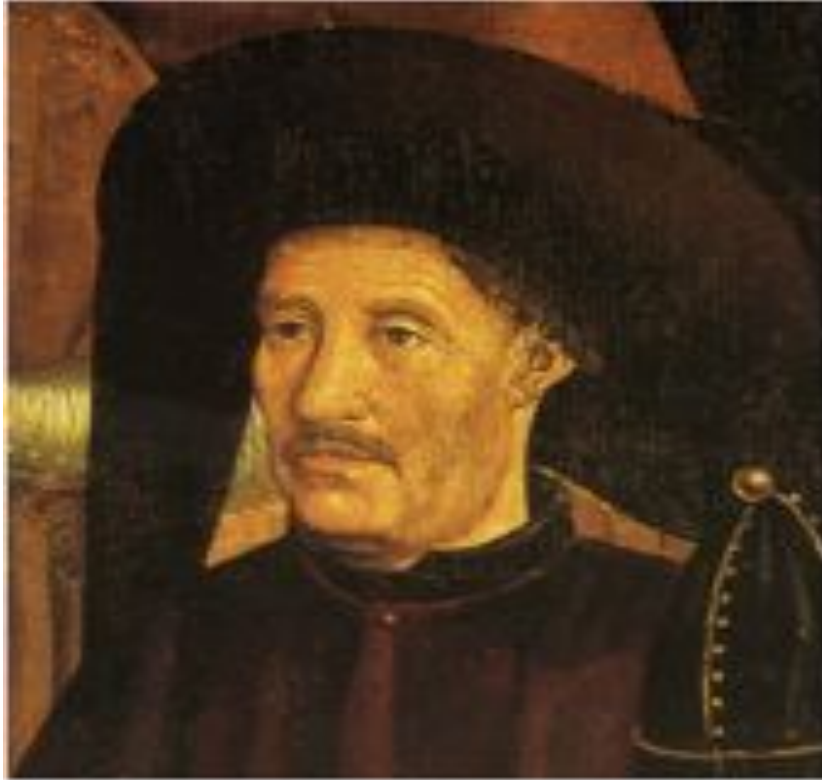
D. Henriques de Zeevaarder

D. Henriques de Zeevaarder (04.03.1394 Porto-13.11.1460), de 3 de zoon van koning D. João I. Grootmeester van de rijke Orde van Christus. Hij was de animator van de eerste Portugese ontdekkingen, die de aanzet gaven tot de opbouw van het Portugese wereldrijk.