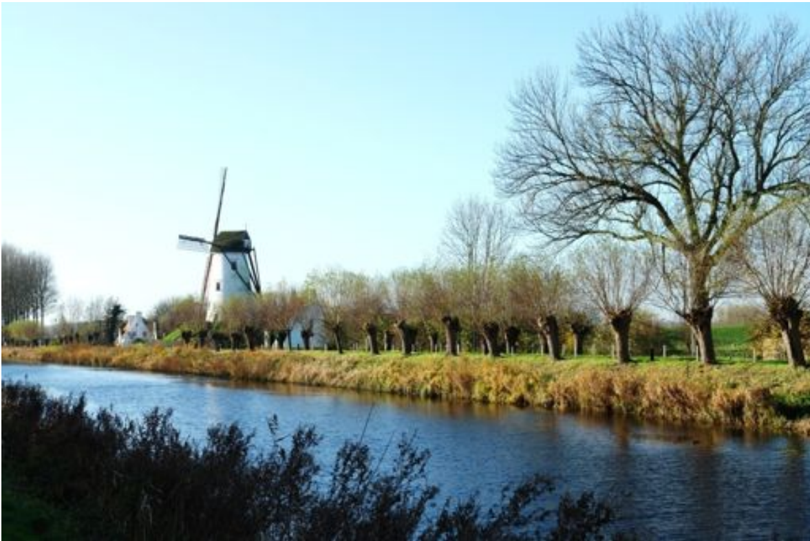
Damse Vaart en windmolen