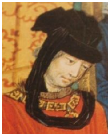
Lodewijk Van Gruuthuyse

G9. Lodewijk Van Gruuthuyse (* circa 1422/27 + 26.11.1492) Brugge. Deze telg van een groot adellijk patriciërgeslacht was in de late middeleeuwen één der meest verdienstelijke Bruggelingen aller tijden. Hij heeft een cruciale rol gespeeld in de literaire, artistieke, culturele en religieuze wereld van de 15 de eeuw. Zijn politieke, diplomatieke en militaire activiteiten waren groots.