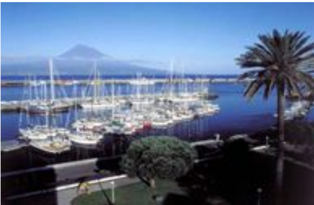
De jachthaven van Faial met zicht op het eiland Pico (Azoren).