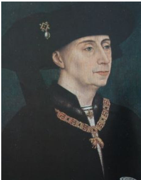
Filips de Goede

1. Filips de Goede, de grote hertog van het Westen (1419-15.06.1467 Brugge), op 07.01.1430 met D. Isabel van Portugal (1397- 17.12.1471).