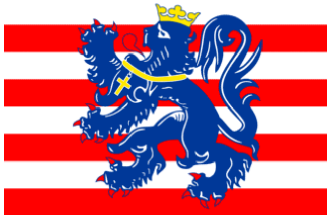
De vlag van Brugge

Tot ca 3000 jaar vóór Chr. was de kuststreek door een stevige duinengordel van de zee afgesloten. Nadien werd de kustvlakte regelmatig overstromd. De poldervlakte zag er toen gans anders uit: nu eens land, dan weer zee, een gebied doorlopen door kreken, onderhevig aan ebbe en vloed. Zo kwam in de 2de eeuw vóór Chr. het zeewater via geulen tot aan de rand van Brugge.