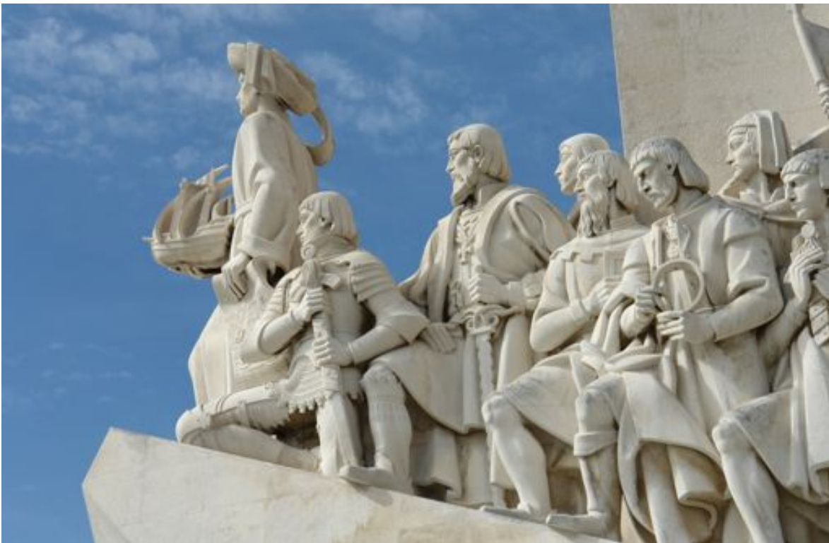
Monument ter ere van D. Henriques de Zeevaarder te Lissabon