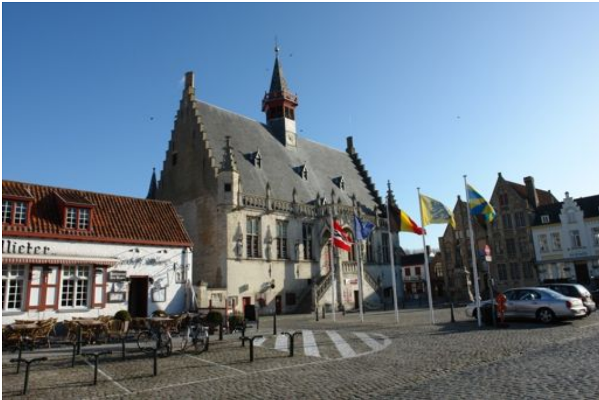
Stadhuis van Damme Opgericht in 1241, herbouwd in 1464

Als reactie op de eerste twee versies van deze studie verspreid op het net, heb ik van vele afstammelingen in het buitenland dankbetuigingen ontvangen. Zo heb ik websites zoals die van www.dholmes.com ontdekt, waarop honderden beden/aanvragen staan van mensen die hopeloos voorouders of naaste familieleden opzoeken, van dewelke zij geen teken van leven meer hebben. Wij willen toch allen weten waar wij vandaan komen! Dan pas beseft ge maar een klein wiertje te zijn in het grote raderwerk, dat mensen voorthelpt hun voorgeslacht te vinden. De verantwoordelijken voor deze websites hebben rechtstreeks contact met de zoekenden en zij hebben dan ook de meeste verdienste bij deze vorm van hulpverlening, die wereldwijd is, juist door de verspreiding van de Portugezen over alle continenten.