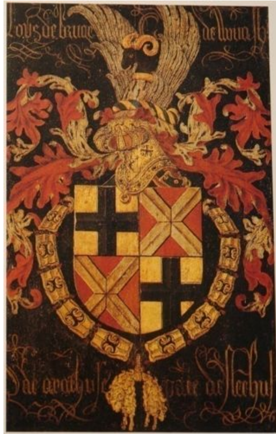
Familiewapen van Lodewijk Van Gruuthuyse met de Orde van het Gulden Vlies