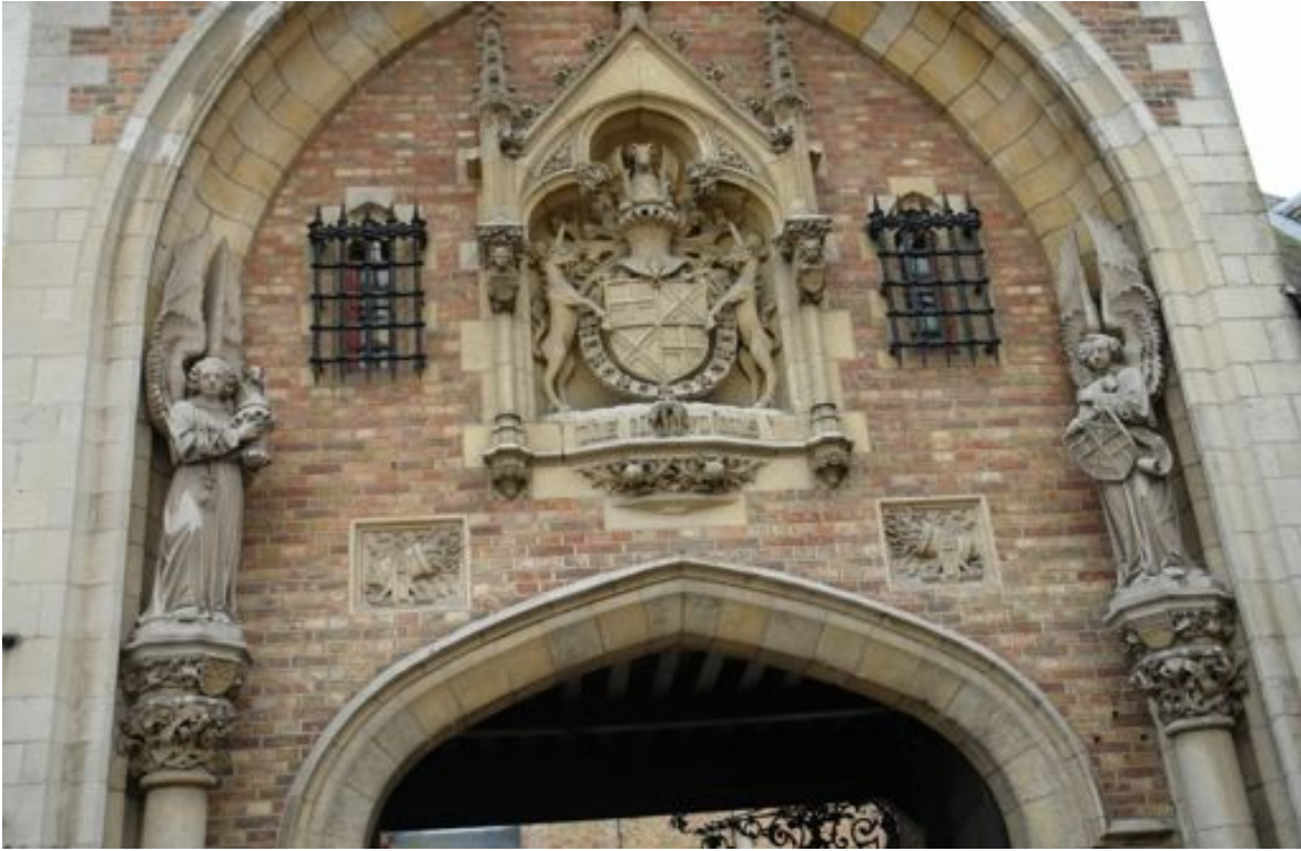
Ingangspoort tot het paleis van Gruuthuyse