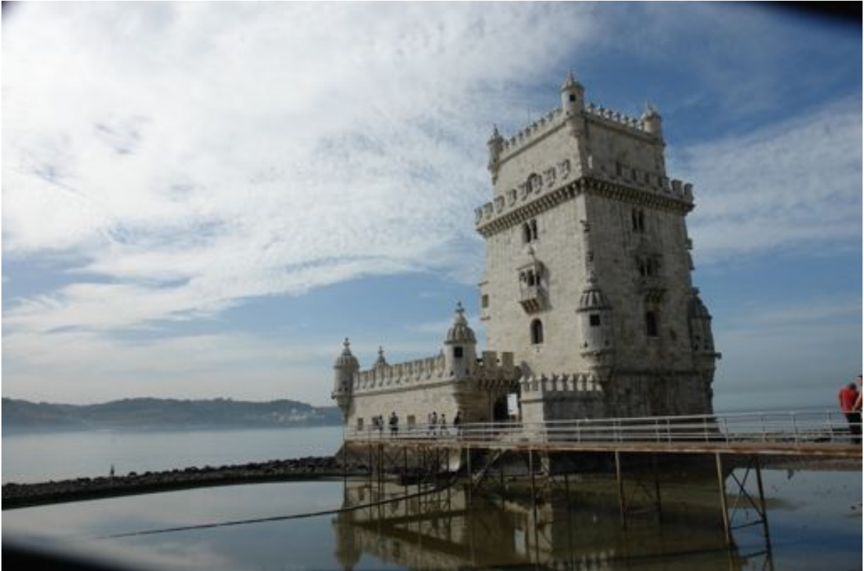
Torre de Belém, Lissabon