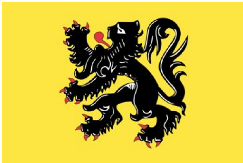
Vlag 'De Vlaamse Leeuw'